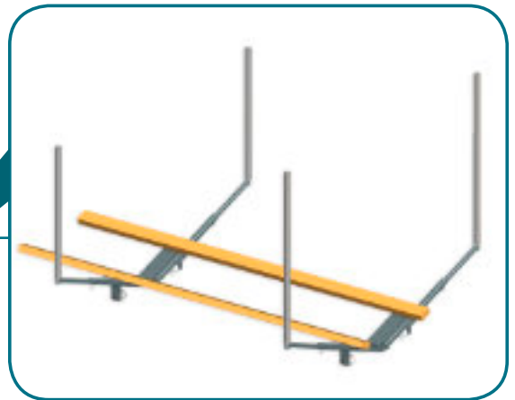
VR-500E / VR-500M

VeneRoller VR-500 rantatelakka soveltuu veneille, joiden kokonaispaino on alle 500 kg sisältäen moottorin, varusteet, bensat ja matkustajat (yleensä alle 30 hv moottorilla varustetut veneet).